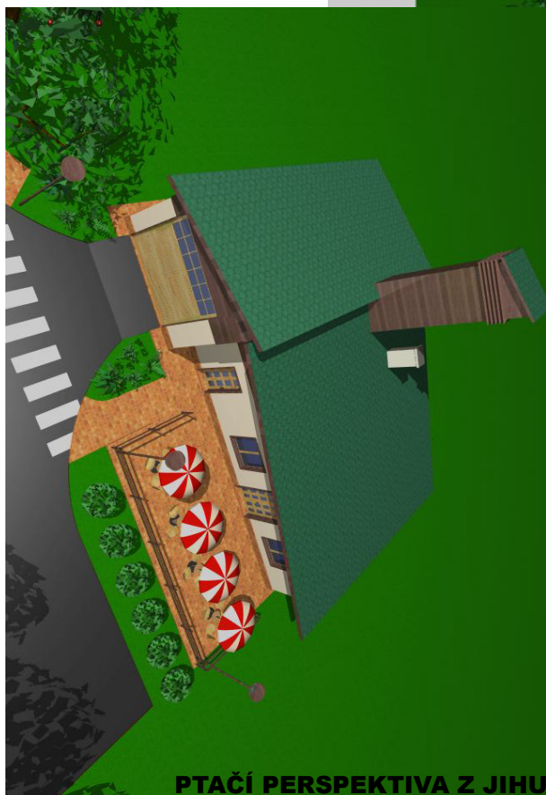
PTAČÍ PERSPEKTIVA Z JIHU