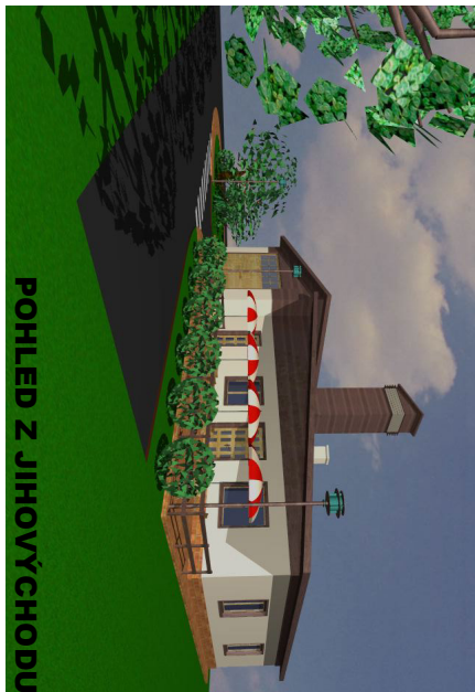
POHLED Z JIHOVÝCHODU