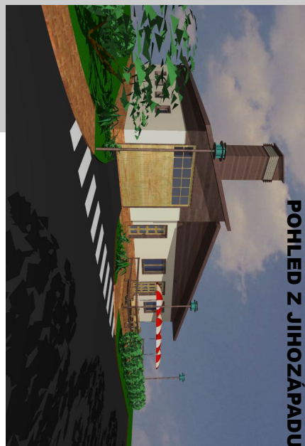
POHLED Z JIHOZÁPADU